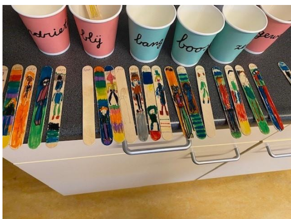
De gevoelsstokjes in groep 4 en 5