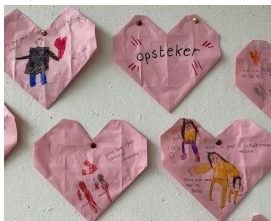
Opstekers geven in groep 1/2